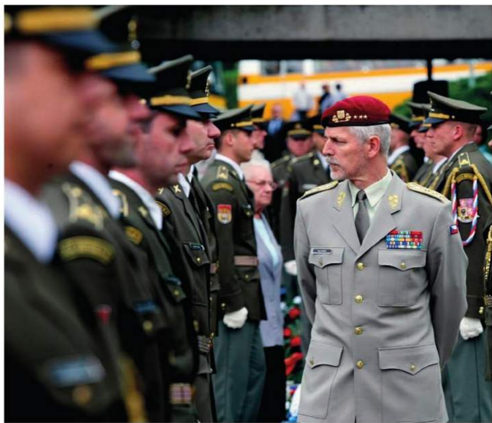
Na Kobyliské střelnici se v pondělí 6. května 2013 uskutečnil pietní akt při příležitosti 68. výročí konce druhé světové války. Na snímku náčelník Generálního štábu Petr Pavel.